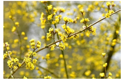
Cornus mas (Kornelkirsche)