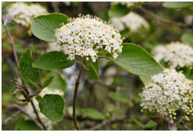
Viburnum lantana (Wolliger Schneeball)

Dem Gemeinderat ist der Erhalt der einheimischen Biodiversität ein grosses Anliegen und er hat am 1. März 2022 ein Merkblatt für die Bepflanzung mit einheimischen Sträuchern und Bäumen erlassen. In diesem Merkblatt sind Bäume und Sträucher aufgeführt, die die Biodiversität fördern. Damit die Förderung optimal gelingt, empfiehlt sich, die im Merkblatt aufgeführten Bäume und Sträucher im Siedlungsgebiet zu pflanzen. Das Merkblatt kann im Online-Schalter der Gemeinde Muhen heruntergeladen werden.