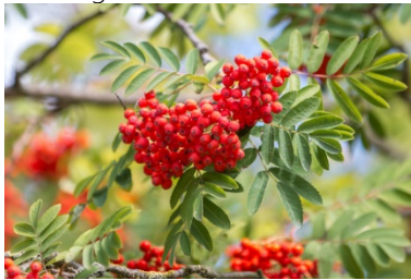
Sorbus aucuparia (Vogelbeerbaum)