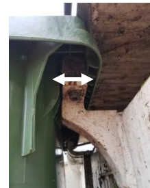
Aufnahme des Behälters am Kehrriehwagen (Breite 3.5 cm)